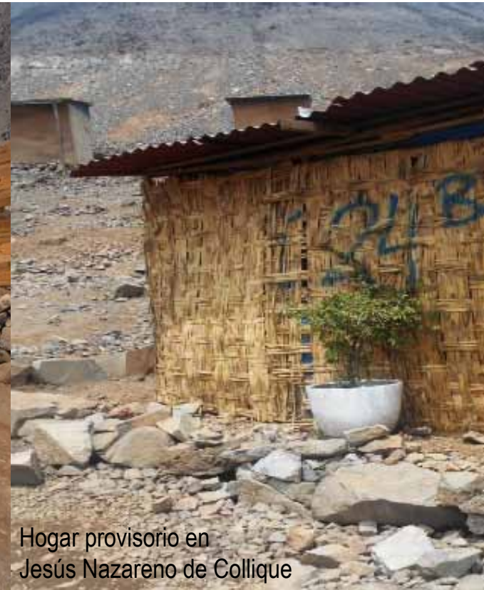
Hogar provisorio en Jesús Nazareno de Collique

“La gente es muy desconfiada por mucho engaño que han sufrido y es un logro muy grande que haya confianza en la organización. La compra entre todos ha permitido abaratar el costo. Lo mismo esperamos lograr en la construcción además de poder utilizar los materiales de la cantera”.