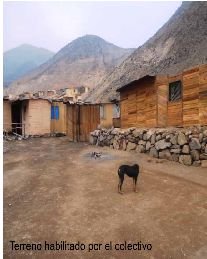
Terreno habilitado por el colectivo