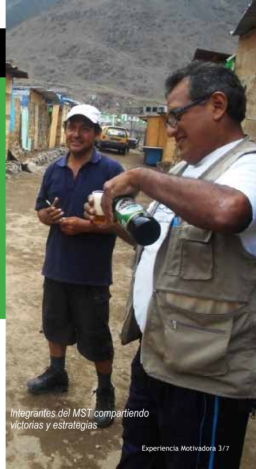
Integrantes del MST compartiendo victorias y estrategias