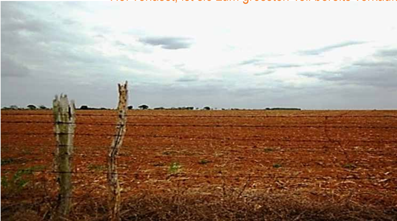
Umgebung, die die Familie bei ihrer Ankunft erwartete.

Die Produktion einer kleinen Milchviehwirtschaft, die sich im Rahmen einer halb verunglückten Landvergabe entwickelte, ist heute die Existenzgrundlage einer Familie. Zunächst wurde experimentiert, um die passende Form der Milchverarbeitung zu finden. Schliesslich blieb man beim Joghurt, der nun statt auf dem Markt in der Nachbarschaft verkauft wird – und zwar mit Erfolg: Wenn die Joghurtlieferung den Hof verlässt, ist sie zum grössten Teil bereits verkauft.